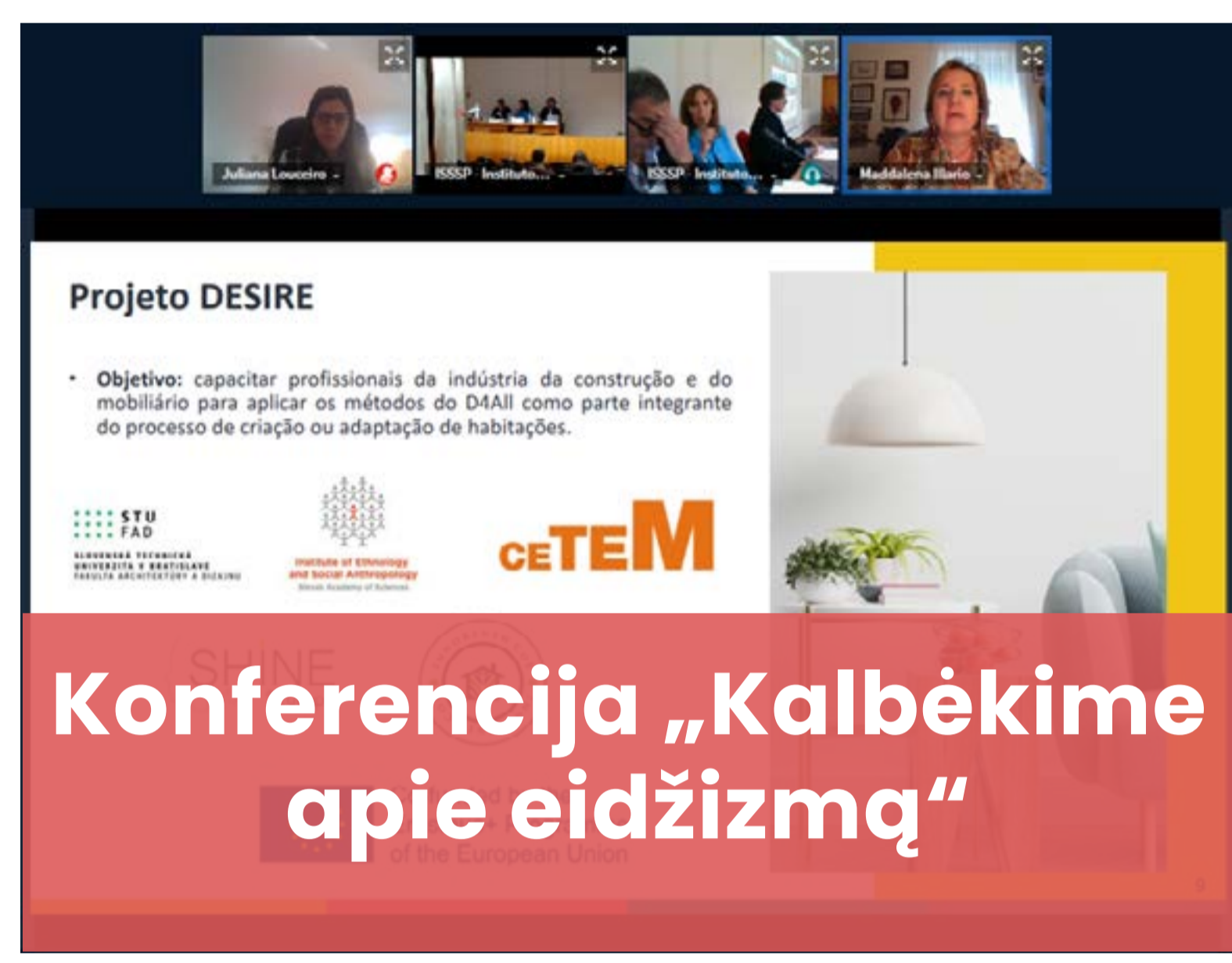
Konferencija „Kalbėkime apie eidžizmą“