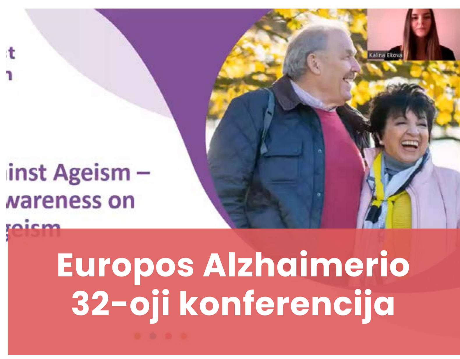
Europos Alzheimerio 32-oji konferencija