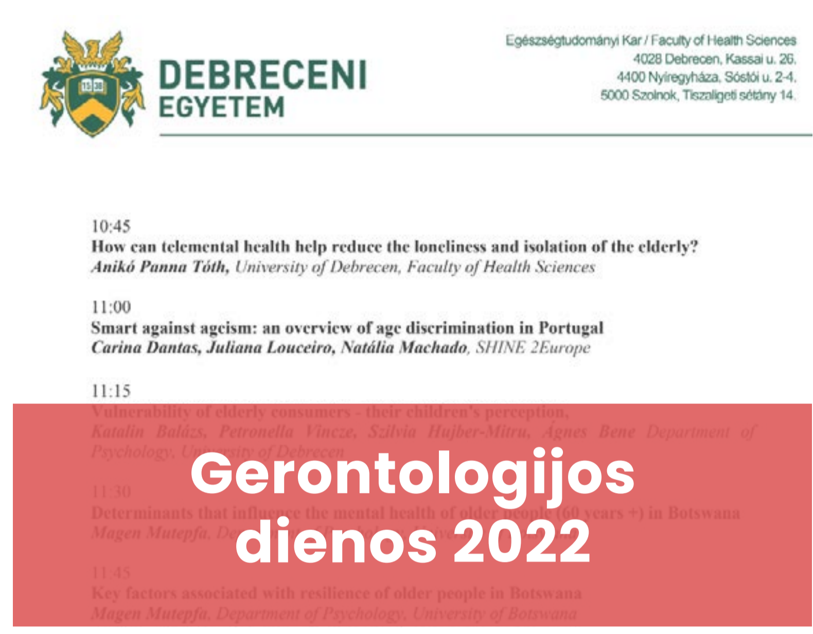
Gerontologijos dienos 2022

SAA projektas pristatytas visoje Europoje, aktyviai skleidžiant žinias ir skatinant bendradarbiavimą.