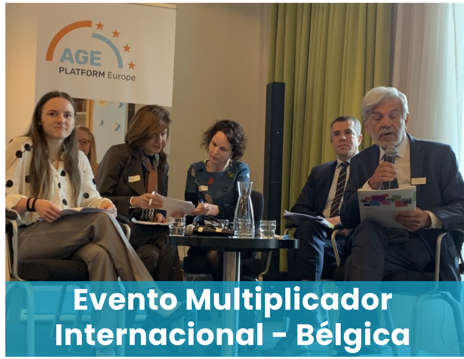
Evento Multiplicador Internacional – Bélgica